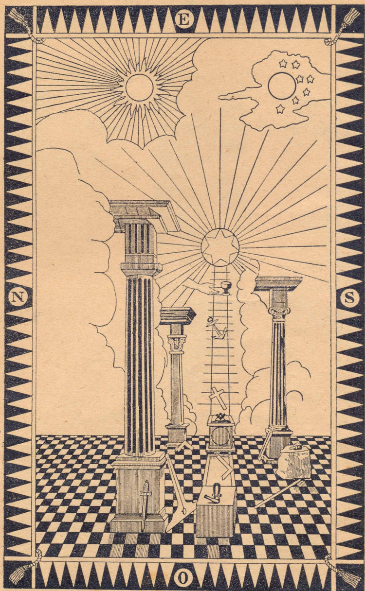
PAINEL DA LOJA DE APRENDIZ