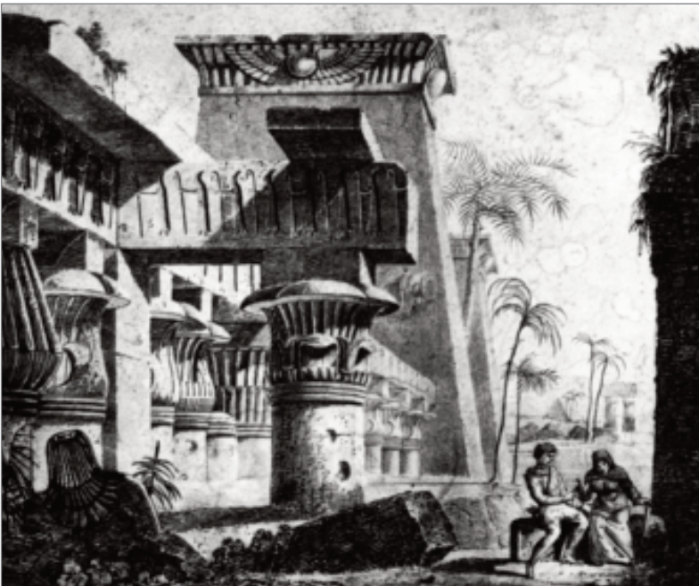
Papageno e a Velha Brünn, 1794.