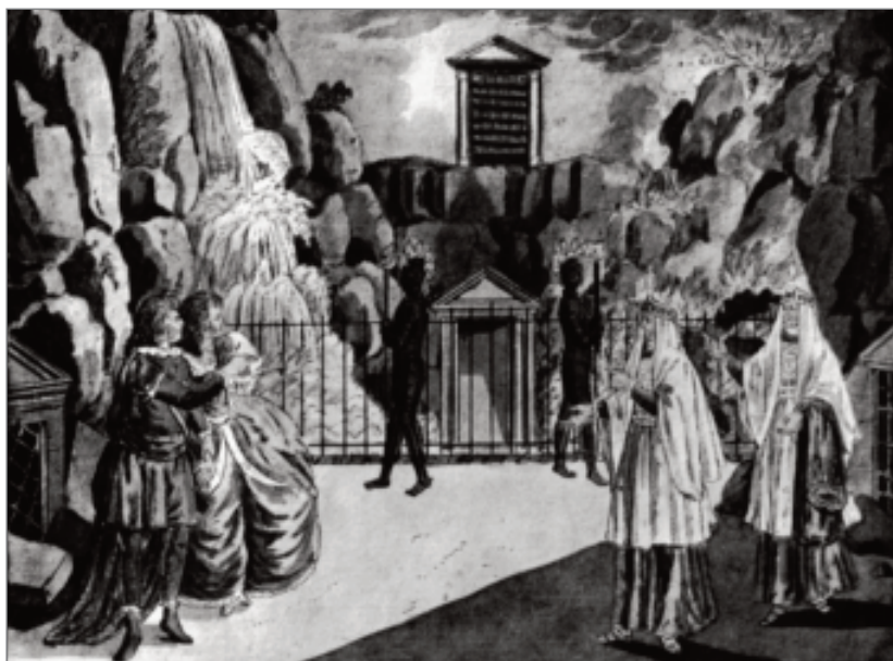
Tamino e Pamina chegam às «portas do terror». Gravura em cobre de Joseph e Peter Schaffner, Brünn, 1795.