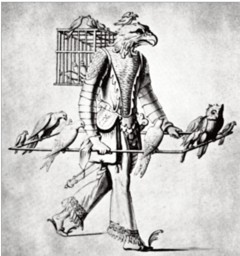
Passarinheiro Figura popular oriunda da Áustria. Desenho do século XVI.