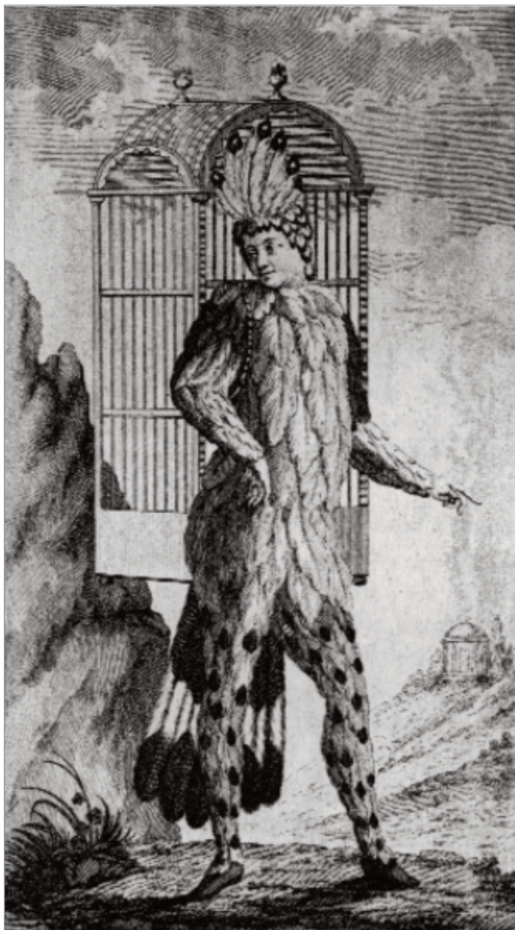
Emanuel Schikaneder como Papageno. Desenho de Ignaz Alberti, 1791, reproduzido na primeira edição do libreto de A Flauta Mágica.