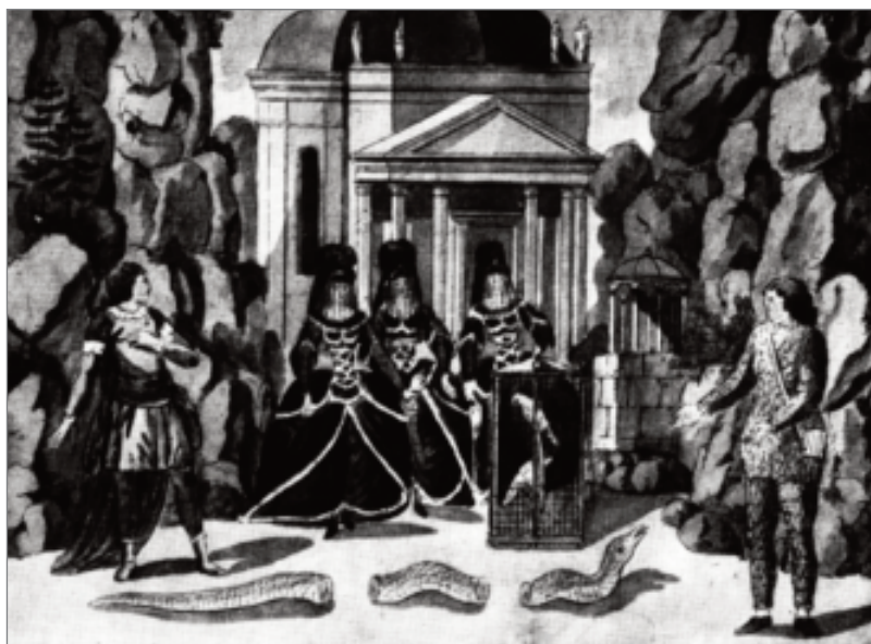
Tamino, Papageno, três damas e a serpente vencida. Gravura em cobre de Joseph e Peter Schaffner, Brünn, 1795.